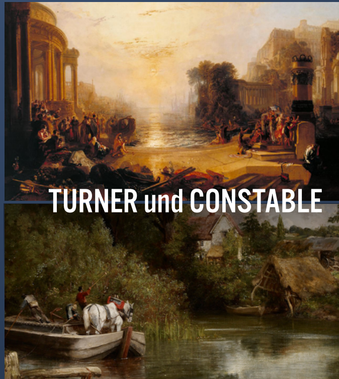
TURNER und CONSTABLE